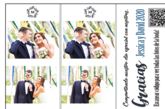
10x15cm, corte de 5cm